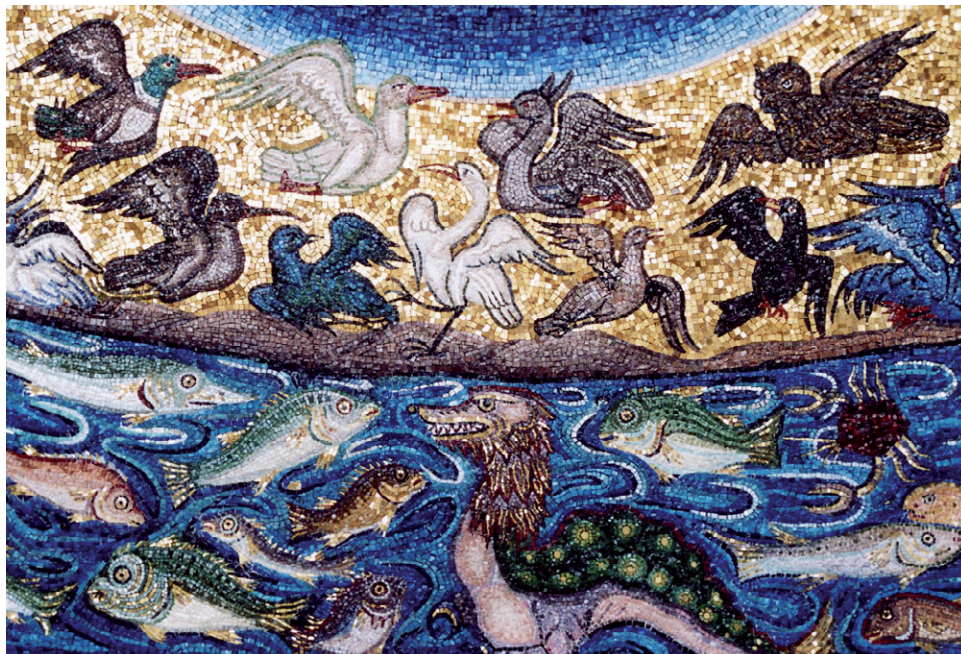
«Création des poissons et des oiseaux», mosaïque d'après San Marco, Venezia