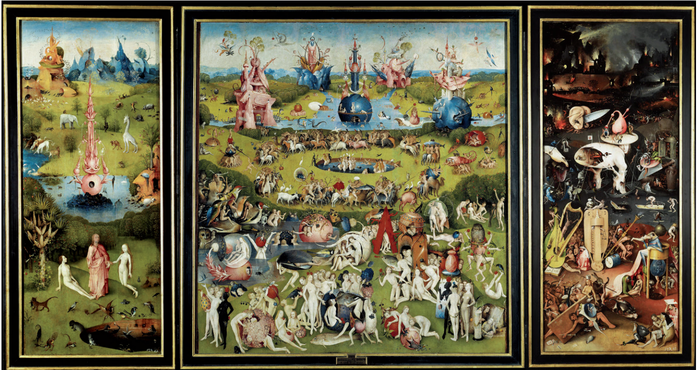
Ce célèbre triptyque de Jérôme Bosch, intitulé « Le jardin des délices » et peint vers 1504, se trouve au Musée du Prado à Madrid. Il illustre bien mon propos. Le panneau de gauche montre Dieu chargeant Adam et Eve d'augmenter l'effectif de l'humanité. Celui du centre montre une multiplication débridée. On voit à droite l'enfer où cela peut conduire.

On ne peut répondre abstraitement à cette délicate question, car les circonstances ne sont pas partout ni toujours les mêmes, et la vie rotarienne doit rester souple. Il y a d'abord une composante historique, qui veut que les clubs anciens accumulent plus de membres par le seul écoulement du temps. Il y a également une composante sociologique, en ce sens que le club Rotary est à l'image de la société dans laquelle il est implanté, y compris pour sa taille. Ainsi, le club d'une ville importante est souvent plus étoffé que celui d'une petite localité. Comme la vie citadine, celle de ces grands clubs est plus large et variée, alors que les petits clubs fa-