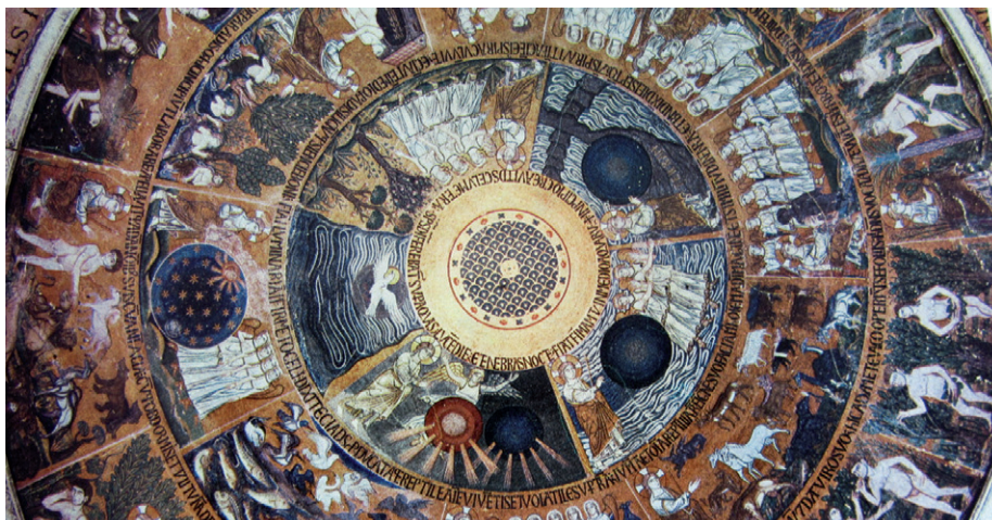
« La création du monde », mosaïque, 1215-1220, San Marco, Venezia

On peut se demander néanmoins s'il existe pour un club un effectif idéal, qui garantirait une meilleure qualité.