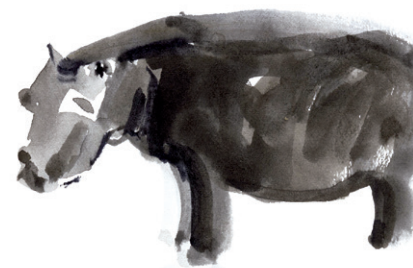
« Etude d'hippopotame », 2014, Isabelle Tabin-Darbellay

Le même équilibre se transpose aux sociétés humaines. La surpopulation décompose le lien social, il n'y a qu'à aller dans certaines banlieues pour s'en convaincre. Les grands empires de l'histoire ont tous fini par s'essouffler et se disloquer. Le Rotary n'échappe pas à cette loi universelle. À partir d'une certaine taille, les clubs mammoth deviennent ingérables. S'il devait grandir inconsidérément, le Rotary finirait par s'étouffer sous son propre poids et s'éteindre comme les dinosaures.