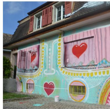
Avenue Marcelin 3 à Morges

Le 29 août 2015, les quais de Morges, la place de Couvaloup, celle de l'Hôtel-de-Ville seront habités par de la musique, de la danse et des créations de graffitis sur toiles etc.